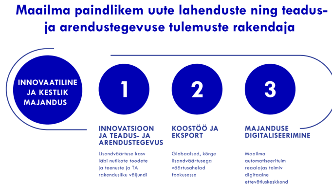
Joonis 1. Koondpilt strateegia valdkonnast Innovaatiline ja kehtlik majandus

Soovitud tulemus: Eesti majanduse kasv tuleb automatiseerimisest ja robotiseerimisest ning TA tulemuste edukast rakendamisest.